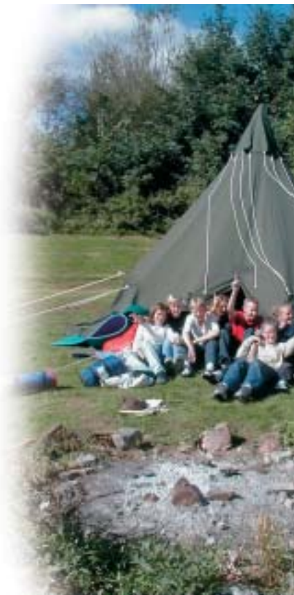
Tipi-lejr i volden – weekendaktivitet i august

Det er en stor og vigtig opgave, hvilket lærergeneringen i det hele taget er . Men vi er startet på et nyt kapitel med optimisme og et ønske om at favne tradition, mangfoldighed og fornyelse.