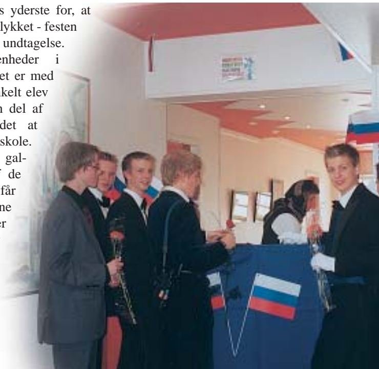
Fra 'Bar Busjska'

gør derfor deres yderste for, at alt skal være vellykket - festen i 2002 var ingen undtagelse. Mange begivenheder i løbet af skoleåret er med til – for hver enkelt elev – at fortælle en del af historien om det at være på efterskole. For mange er gallaaftenen en af de oplevelser, der får en stor stjerne når de tænker tilbage på Hørby Ungdomsskole.