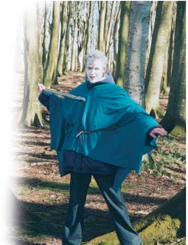
Den gode eller den onde?

Torsdag var dagen, der var udset til den Store Kamp. Alle grupper var så beredte som muligt, og mødte kampklare på stadion til nogle „prøvekampe“. Herefter var alle klar til at marchere til kamppladsen, der var henlagt til Haven Skov. Under meget kyndig ledelse blev slaget sat i gang, og hvilket slag. Orkerne kastede den ene angrebsbølge frem efter den anden, og Elverne forsvarede sig med stort mod og megen snilde. Alle væsnerne bidrog med deres evner til en lang og udmarvende kamp, der for nogle endte i den visse død. Som det altid går i rigtige eventyr sejrede det Gode til sidst, men alle havde bidraget til en fantastisk uge i fantasiens verden.