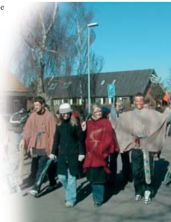
På vej til kamppladsen

Mandag formiddag drog så alle eleverne, dværg-ene, ringånderne, ork-erne, og hvem der nu ellers var, afsted mod Rubjerglejren. Denne skulle danne rammen om en neutral forberedelseszone, hvor vi de næste par dage skulle gøre os klar til den endelige kamp mellem det Gode og det Onde. Timerne fløj afsted, og de forskellige grupper fik lavet skabelsesberetninger, identiteter, dragter, våben og andet tilbehør. Våbnene og andet udstyr blev behørigt kontrolleret af Søren fra Aalborg Rollespilslaug, der var kommet for at være med de sidste dage. Der blev desuden lejlighed til at afprøve den