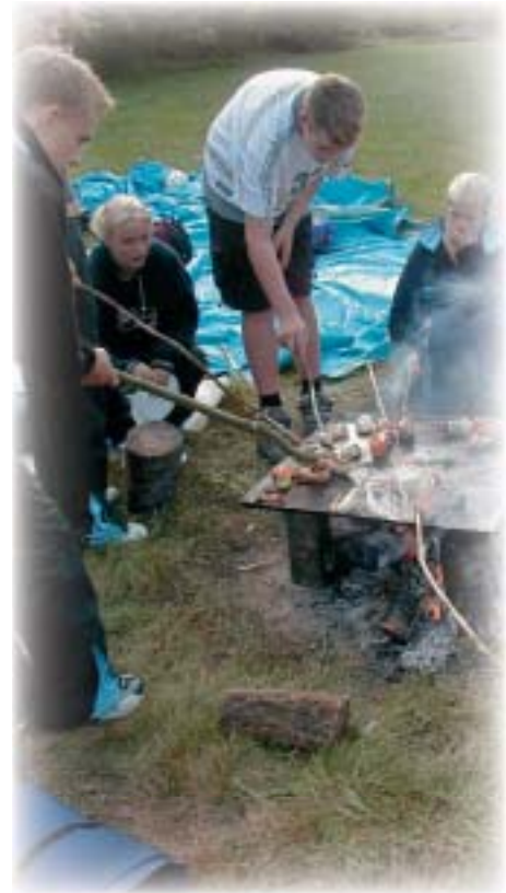
Elever på klassesetur – september 2002

til skolen er elev, forældre, medlem af skolens bagland, altså alle der har berøring med Hørby Ungdomsskole. Til ALLE skal der lyde et godt nyt år .