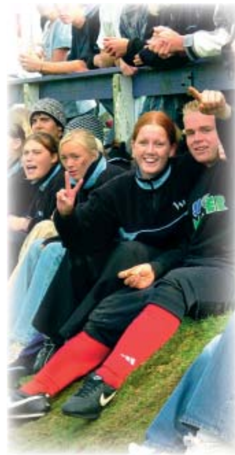
Opbakning til gulddrengene ved NM 2002.