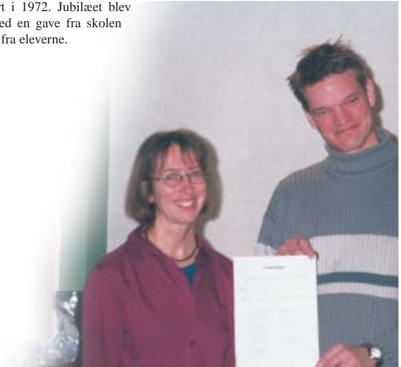
Forfatteren og komponisten til 'Hybenrosen'

skolens start i 1972. Jubilæet blev markeret med en gave fra skolen og hurraråb fra eleverne.