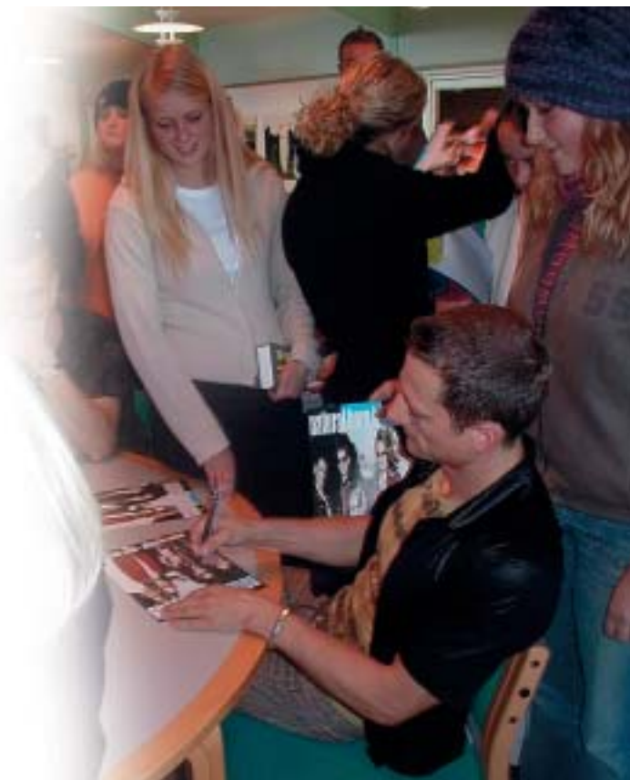
Autografjægere efter koncerten med Natural Born Hippies

På den måde håber vi at kunne oparbejde en pulje penge, der skal virke til glæde for nuværende, kommende og gamle elever samt lokalsamfundet. Gode kulturelle oplevelser skaber gode og glade mennesker, og gode og glade mennesker gør verden bedre.