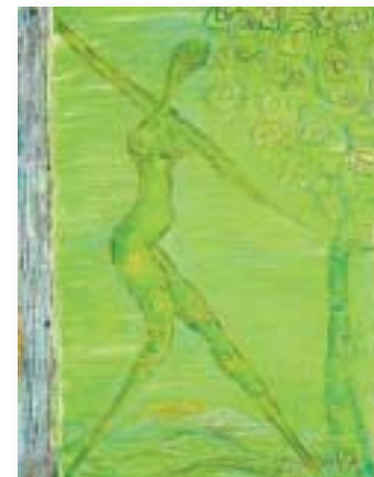
'Grøn dame' af Trine Holm