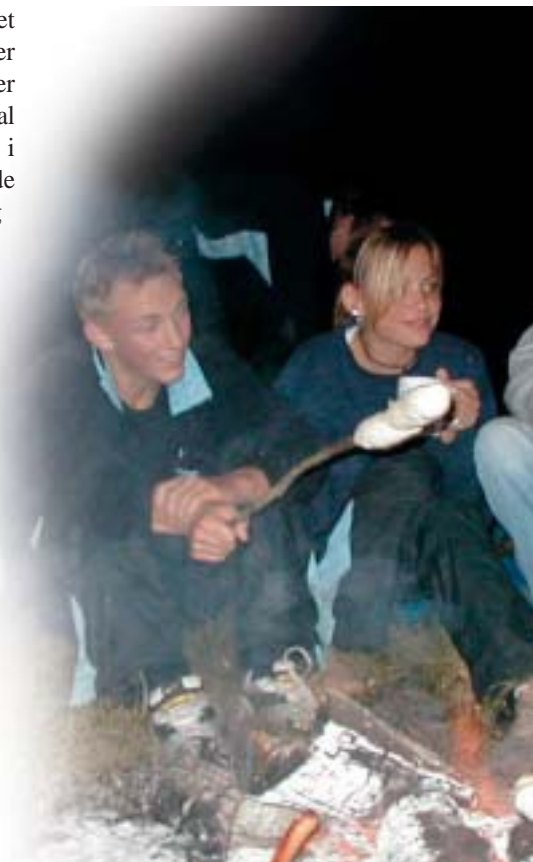
Elever på klassesetur – september 2002

som rap. Deltagerne kan også sende et stikord på SMS til rapperne, som så laver en free-stylerap over emnet. Til sidst laver vi en SMS-battle, hvor deltagerne skal stemme på, hvem der klarer sig bedst i en rap, som f.eks. handler om det gode og det onde - eller om kærlighed og had. Undervejs har deltagerne også modtaget flere SMS'er på deres telefon med spørgsmål eller statements om kristendommen. Alt i alt 2 timer, hvor du både synger og beder, hører Ordet og går til alters, beder Fadervor og ..... nå ja, Velsignelsen. Den kommer som en SMS et kvarter efter, at de har forladt kirken. Gå med fred og tjen Herren med glæde. Det er ikke sidste gang, at de teenagere har været i kirke!