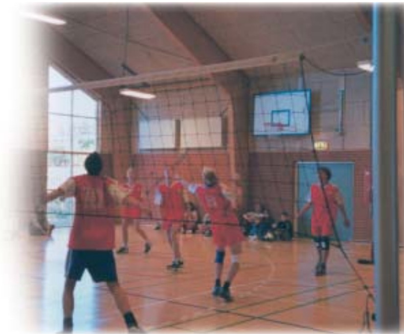
Drengene fra Hørby til volleystævne

så sæt kryds i kalenderen ved 1. søndag i november fremover, få fat på holdet og tilmeld jer til skolen 14 dage før, og få endnu en volleyball-oplevelse du ikke glemmer.