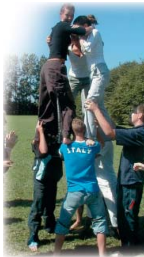
Akrobatik – en af aktiviteten i introugen

Skal Hørby Ungdomsskole have en plads i efterskoleverdenen i fremtiden, er det vigtigt med visioner. En af vore visioner her på skolen er, at vi skal være i konstant udvikling, når det handler om vores pædagogiske tilgang til arbejdet med eleverne – både hvad angår den konkrete undervisning, men også når det handler om at kunne møde de unge, der vælger vores skole. Hvis vi i fremtiden skal spille en rolle, må vi være klar til at stå som ærlige og autentiske personer over for eleverne. Det kræver en ramme om jobbet på efterskolen, hvor der er mulighed for at udvikle sig i forhold til opgaverne – en ramme som ledelsen klart skal være medspiller i at skabe.